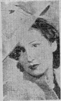
La Moda en Paris. "Un rien" fieltro verde con gros grain Burdeos. Creación Rams.

El Gran Baile en el Teatro Nacional a beneficio del Asilo de los Incurvables