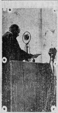
El Sr. Daladier pronunciando un importante discurso durante el banquete que le fue ofrecido por la ciudad de Lyon después de la inauguración del Monumento a los Muertos del Servicio Sanitario durante la guerra.

VALENCIA, 11. — Cinco aviones nacionalistas tipo Savoia incurrieron contra el puerto de Alicante en la mañana de hoy, arrojando cerca de cien bombas sobre el barrio de San Julián y los distritos obreros en las afueras de la ciudad. Las baterías anti-aéreas mantuvieron un nutrido fuego contra los invasores, dañando a doce de los aparatos, de los cuales tan se vio obligado a acuatizar a uno