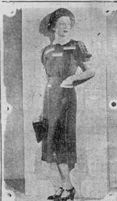
La moda en Paris. "Intran" Vestido para el campo y fines de semana en blanco. Creación Anny Blatt.