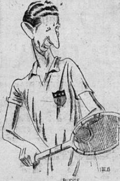
BUDDGE ses lo derrotó en Australia. El barón Von Cramm, que tal es su nombre, está cumpliendo en una cárcel de Alemania la condena de un año, que, por un delito contra la honestidad, le impusieron los tribunales de Hitler.

Este año Donald Budge no tendrá que enfrentarse con el adversario más peligroso que ha encontrado en los últimos tiempos, que hace años me-